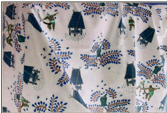
Gambar 5. Batik Uma Lengge Bura

merata, sehingga mendatangkan kemuliaan hidup bersama. (3) Aktivitas kesenian berupa gerakan tari yang ritmis dan dinamis melambangkan spirit doa dan daya juang masyarakat Bima dalam menggapai kemenangan. Ketersediaan makan yang cukup, terjaganya keseimbangan hidup, dan tergapainya keberhasilan/kemenangan mendatangkan kebahagiaan lahir dan batin.