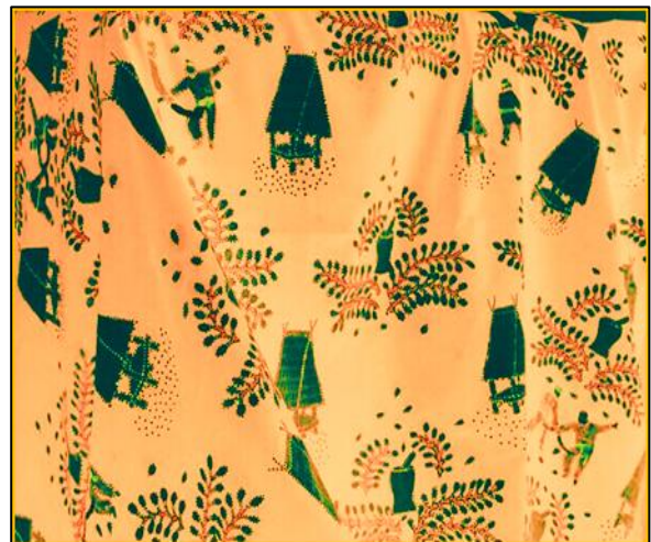
Gambar 3. Batik Uma Lengge Monca

menjadi segitiga emas pertanian bersama Makassar dan Ternate pada zaman Kesultanan. Sifat suku Bima juga terbuka dalam menjalin hubungan dengan suku-suku lain di Nusantara, sehingga selera terhadap warna-warna pun bervariasi. Sebagaimana ciri masyarakat pesisir yang dinamis dan terbuka (Salma, 2013). Penerapan warna-warna dasar batikan yang berbeda dalam beberapa BUL ini juga merupakan usaha mendekati selera konsumen dalam memilih warna yang disukai. Beberapa contoh kain BUL yang diberi warna-warna dasar yang berbeda dapat dilihat dalam Gambar 3, Gambar 4, Gambar 5, dan Gambar 7.