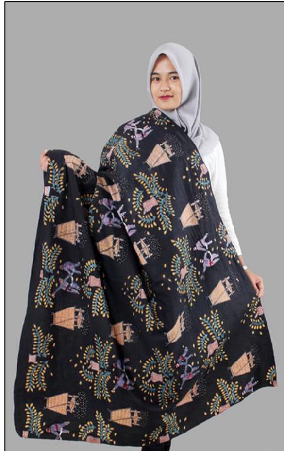
Gambar 7. Batik Uma Lengge Me'e

Kolo, Pantai Sonumbe, Museum Asi Mbojo, Gua Ringi Ncanga, Pulau Kambing, dan lain-lain (Alfri, 2016). Selain itu juga terdapat beragam aspek budaya yang dapat dijumpai di daerah ini, mulai dari pacuan kuda, upacara adat, tarian tradisional, nyanyian khas daerah, transportasi tradisional, dan kuliner khas Bima.