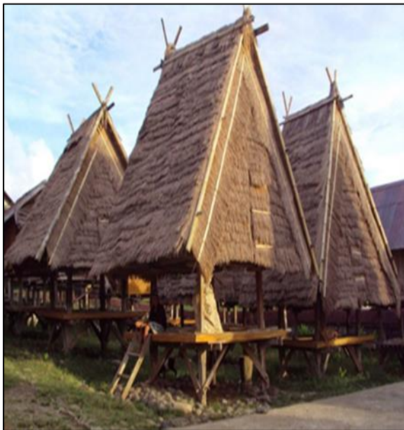
Gambar 1. Uma Lengge di Bima

Komplek Uma Lengge atau Uma Jompa yang umurnya sudah ratusan tahun dan masih dilestarikan dan dijadikan objek wisata terdapat di Desa Maria, Kecamatan Wawo, Kabupaten Bima, Pulau Sumbawa. Penempatannya yang terpisah dengan rumah tinggal penduduk, dimaksudkan untuk mencegah masyarakat berlaku boros, dalam mengkonsumsi persediaan makanan. Pengambilan persediaan makanan mentah atau padi hanya boleh seminggu sekali dengan menyesuaikan pada kebutuhan. Hal ini untuk mengantisipasi masa panen hanya dilakukan sekali dalam setahun seiring turunnya hujan yang hanya turun pada sekitaran bulan Juni saja. Bentuk bangunan Uma Legge dapat dilihat dalam Gambar 1.