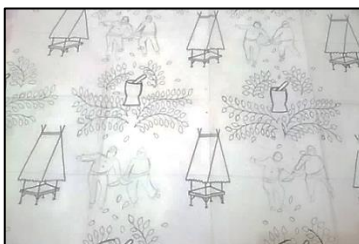
Desain motif batik