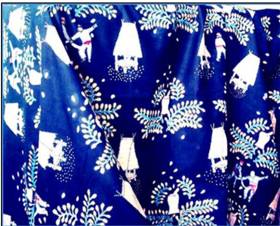
Gambar 4. Batik Uma Lengge Biru

Desain motif batik merupakan karya yang berwujud yaitu bisa dilihat dan disentuh, yang berarti karya seni sebagai sebuah benda. Estetika dari suatu karya seni selalu mempersoalkan bentuk dan isi/makna. Persoalan bentuk meliputi elemen-elemen rupa dan penyusunannya, yang merupakan representasi, imajinasi, simbol, metafora, dan lain-lain. Persoalan isi/makna adalah tentang nilai kognitif-informatif, nilai emosi-intuisi, nilai gagasan, dan nilai-nilai hidup manusia (Salma dan Eskak, 2012). Unsur bentuk dan isi/makna karya seni BUL ini dikaji keterkaitannya satu sama lain.