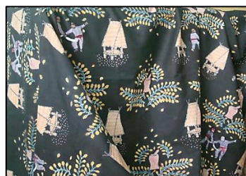
Hasil karya batik